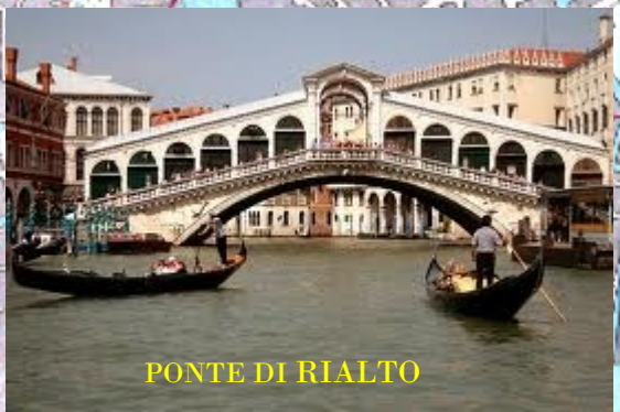
PONTE DI RIALTO

Vettori: Agenzia Viaggi Sassi - Minervino Muge Raffaello Navigazione - Chioggia People mover- Venezia